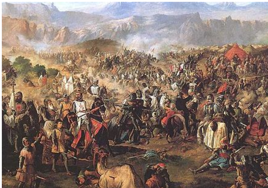
Bataille de la Navas de Tolosa, 1212, victoire décisive de la Reconquista pour les chrétiens.