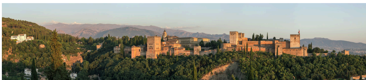
L'Alhambra (القَلْعَةُ الْحَمْرَاءُ) à Grenade, joyaux de l'architecture islamique médiévale en Espagne